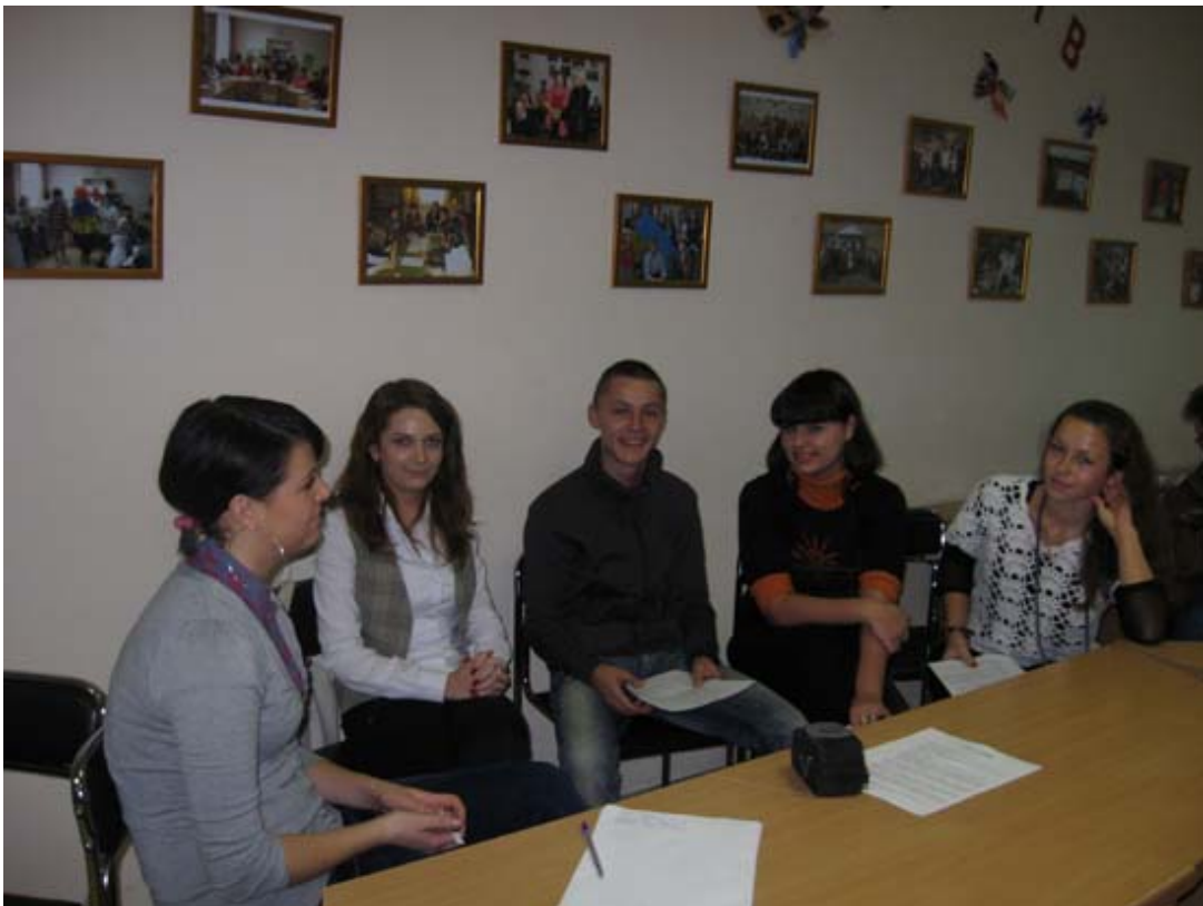
Члени клубу "Позитив" під час роботи в підгрупах