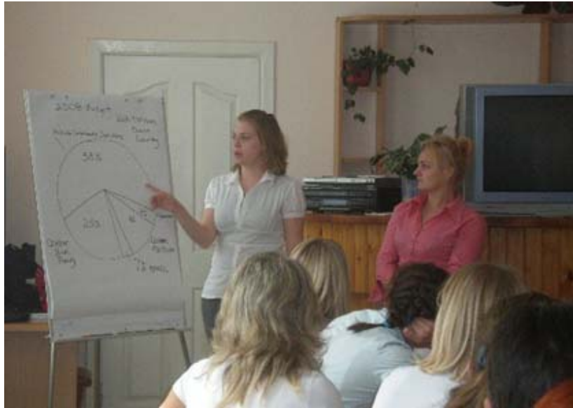
OLYMPUS DIGITAL CAMERA